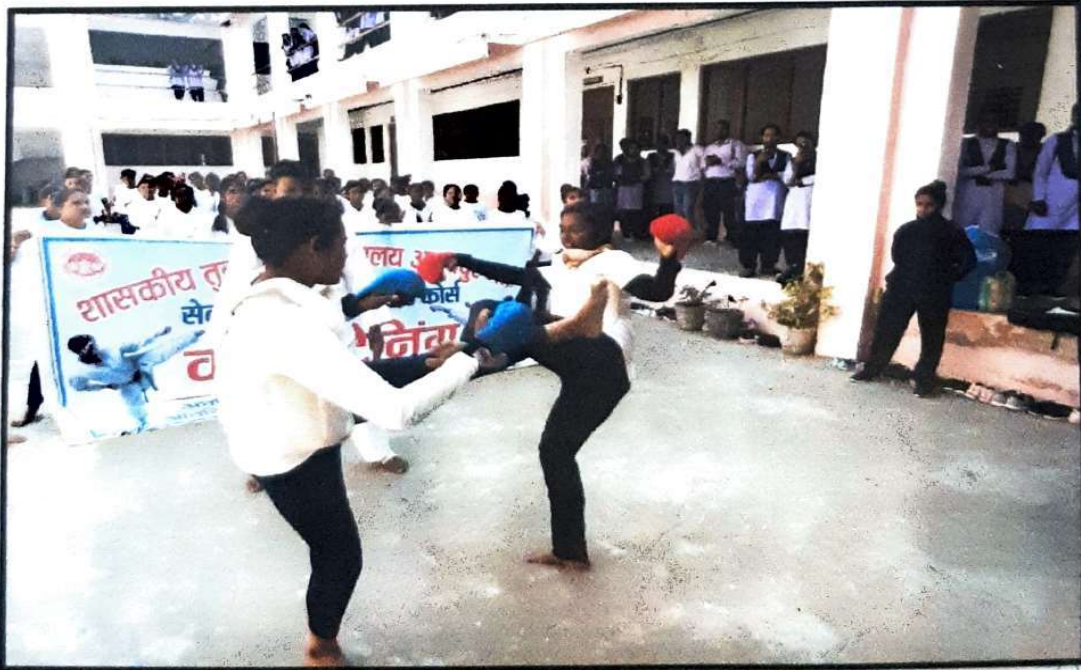
प्रशिक्षण प्राप्त विद्यार्थियों द्वारा कराटे का प्रदर्शन

PRINCIPAL Govt. Tulsi College Anuppur Distt. Anuppur (M.P.)